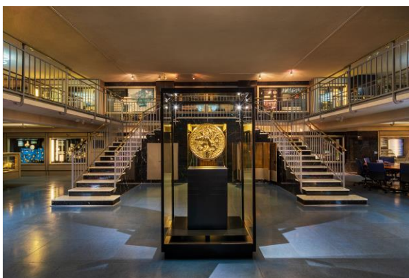
Stávající expozice Lidé a peníze v Praze