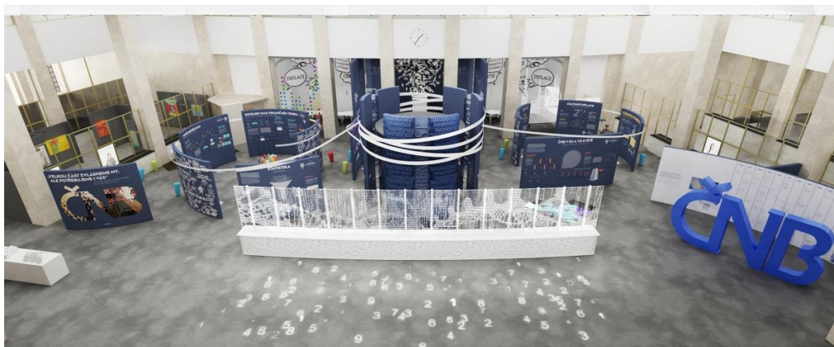
Vizualizace Návštěvníkého centra vznikajícího v původních prostorách bankovní haly ústředí ČNB