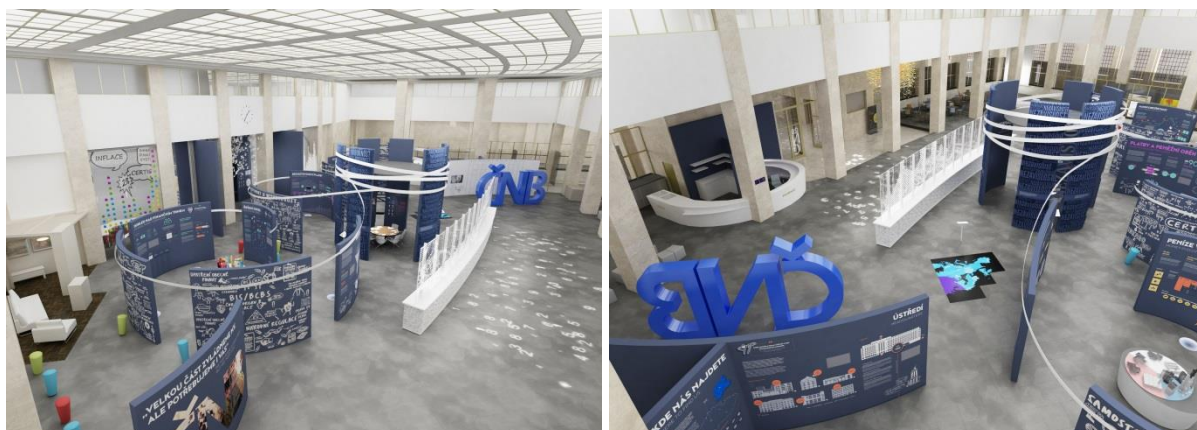
Vizualizace Návštěvníkého centra vznikajícího v původních prostorách bankovní haly ústředí ČNB